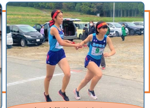
女子中継所 たすきリレー