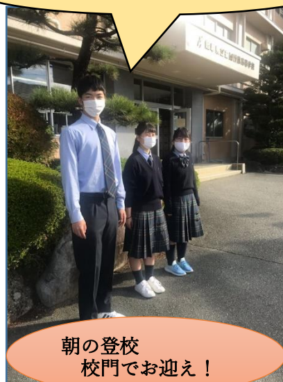
朝の登校 校門でお迎え！