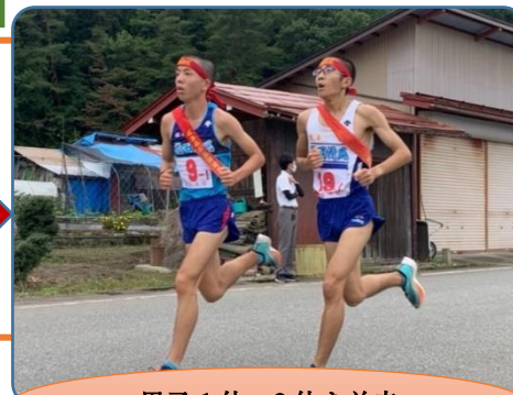
男子1位・2位を並走