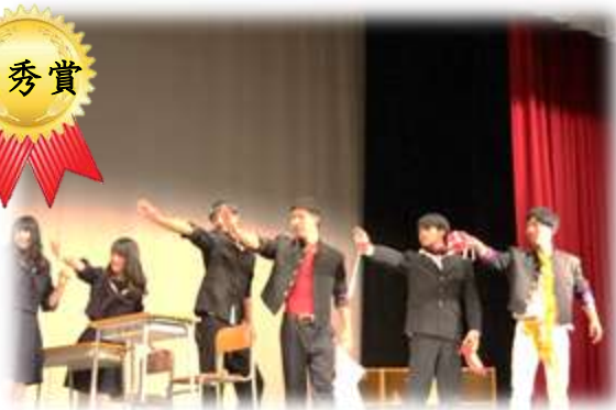
3F 白雪姫と鏡の女王