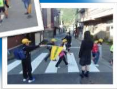
通学路での見守り活動

小学生はみんな笑顔で挨拶を返してくれて、心が温かくなり、清々しい気持ちになりました。また、挨拶の大切さを感じました。