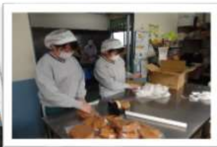
商品の袋詰め作業