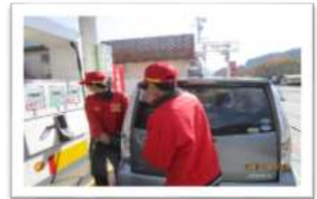
ガソリンスタンドでの業務