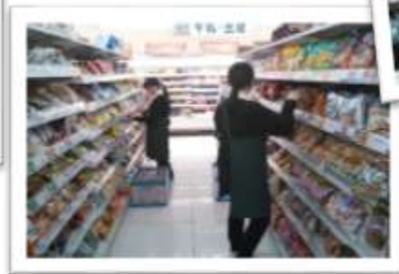
ドラッグストアで商品陳