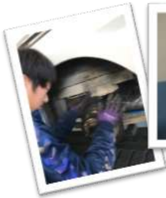
整備工場での作業