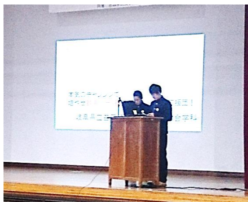
宮城県での発表風景