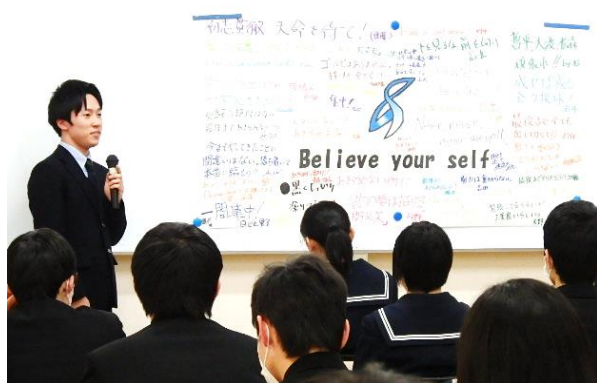
激励会にて（生徒会長から激励のメッセージ）