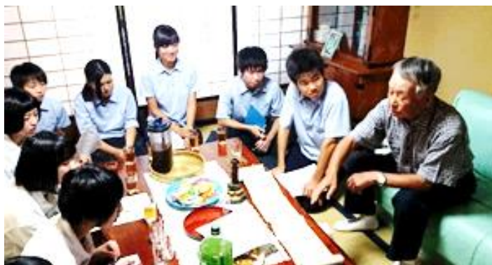
地元の方からお話を聞き調査