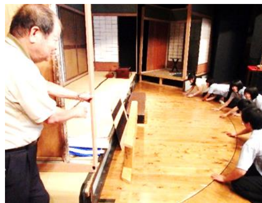
鳳凰座歌舞伎保存会会長さんからお話を聞く様子

ご協力いただいた皆様に感謝申し上げます。これからも地域に根ざした学習活動を進めていきます。