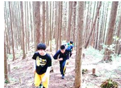
仏ヶ尾山でのフィールドワーク