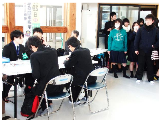
会場で受付をする生徒と待機する生徒

放課後の投票所には選挙権を有する生徒がこの機会に投票をしようと次々と訪れ、生徒42名が投票を行いました。