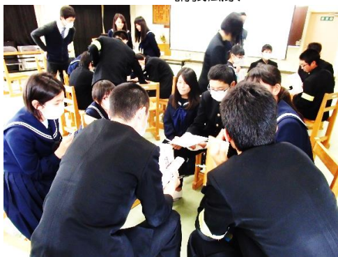
中学生とのグループワーク