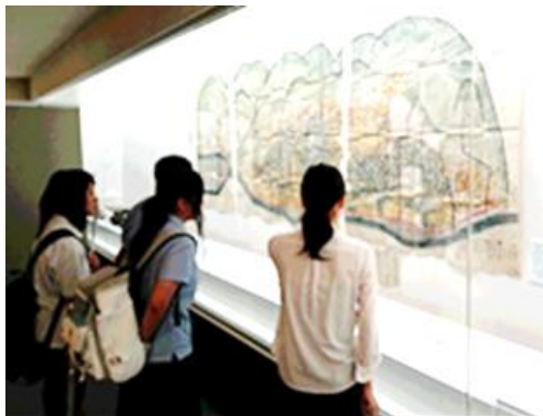
下呂市ふるさと記念館での調査