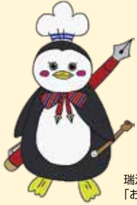
瑞浪高校公式キャラクター「おとめちゃん」