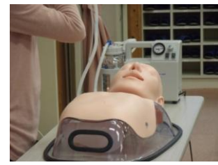
▲医療的ケアの学習用具