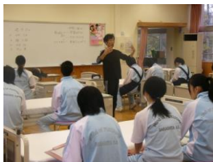
▲介護実習事前学習

社会福祉基礎、生活支援技術、コミュニケーション技術、介護福祉基礎、介護過程、介護総合演習、介護実習、こころとからだの理解(こころとからだのしくみ、発達と老化の理解、認知症の理解、障害の理解)、家庭基礎