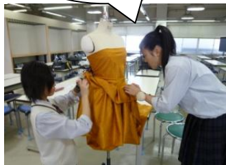
専門学校での実習