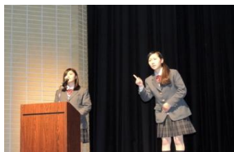
発表は手話で同時通訳