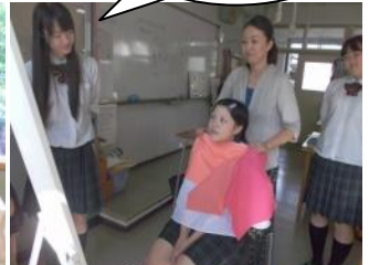
パーソナルカラー