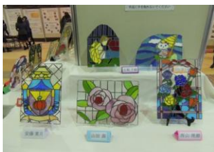
ステンドグラスの展示