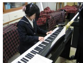
子ども福祉実習室