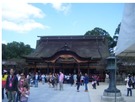
●福岡県 太宰府天満宮