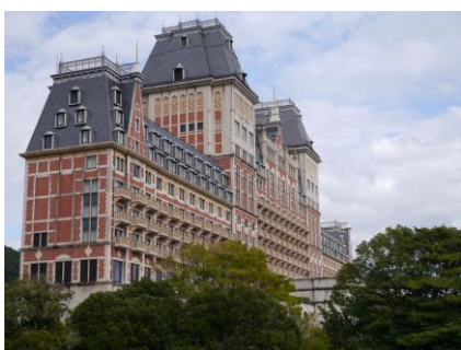
●ホテルオークラ JRハウステンボス