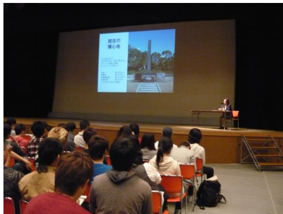
●平和講話 ホールの様子