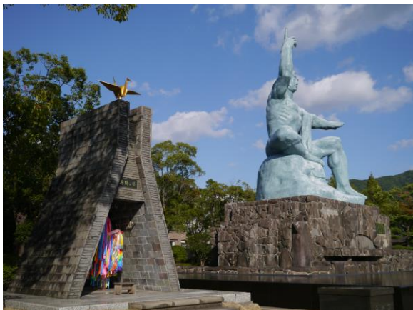
●平和公園内の様子