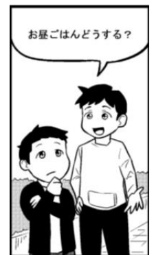
授業で用いる教材の例

学校設定科目として、1年選択科目に「 コミュラボ入 門 」、さらに深めたい人に、「 コミュラボ自立 」の講座 があります。コミュラボでは、SST(ソーシャル・ス キルトレーニング)を行います。 実際の場面を想定して(友達との 会話や、SNSでのやりとりな ど)よりよいコミュニケーション を学ぶことができます。