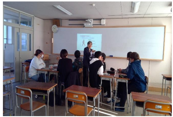
[社会人基礎力講座]