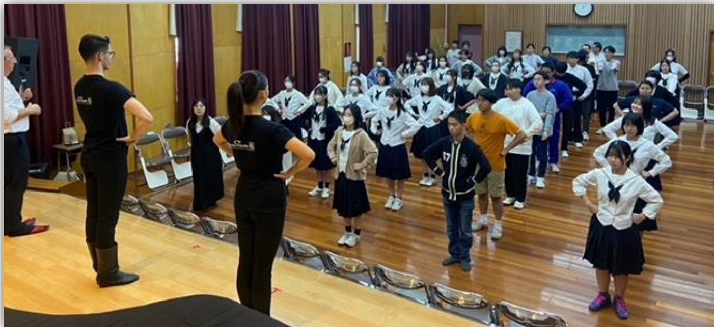
(↑ポーランド国立民族合唱舞踊団のみなさんと音楽科の生徒たち)

ポーランド国立民族合唱舞踊団「シロンスク」の皆さんとワークショップを行いました。今年はポーランドの伝統舞踊であるクラコヴィアク (krakowiak) のレッスン受け、音楽科の生徒47名でクラコヴィアクにチャレンジしました。