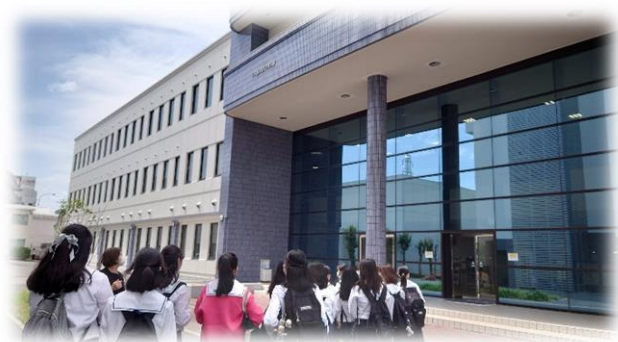
大阪音楽大学につきました ♪