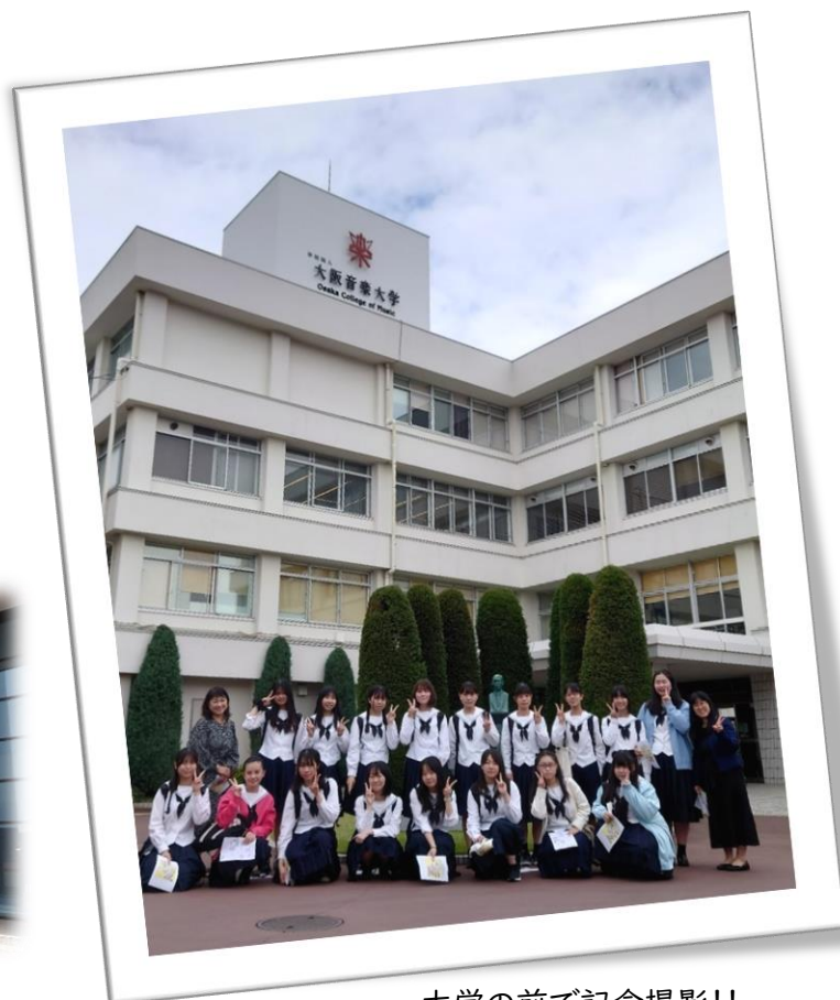
大学の前で記念撮影！！