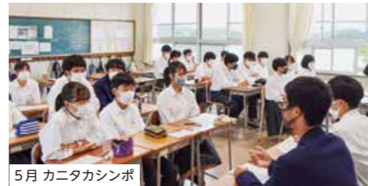
5月 カニタカシンポ