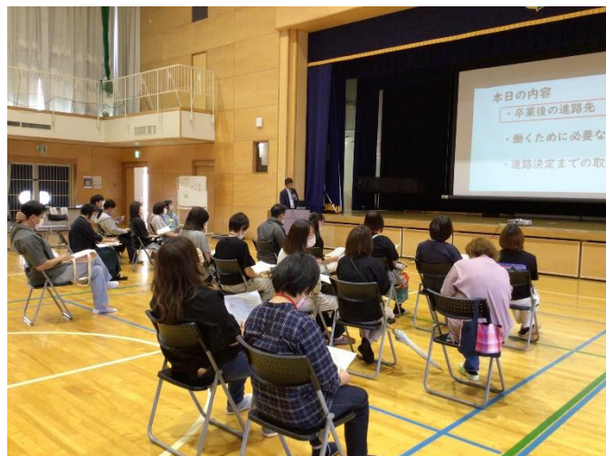
※「進路についての講話」