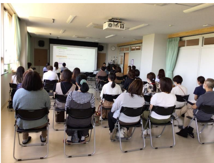
※「進路についての講話」

★もっと話を聞きたかったと同じような企画を希望する声も多数あり、有意義な時間を過ごすことが出来ました。