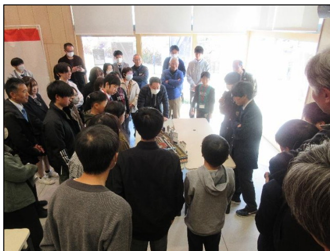
プレゼンテーション後の交流会の様子