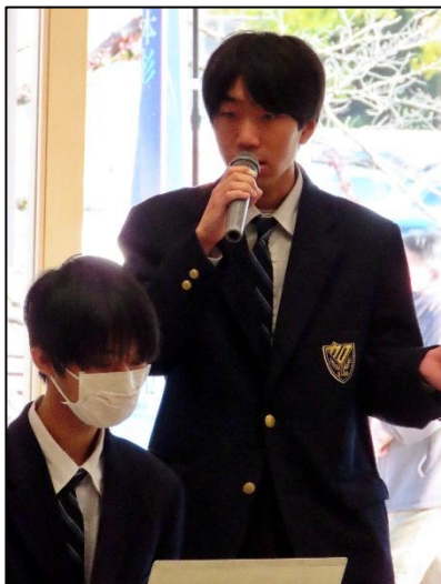
プレゼンテーションの様子

なお、発表で使用した坂祝駅のジオラマは、後日展示やプレゼンテーションを行う予定です。