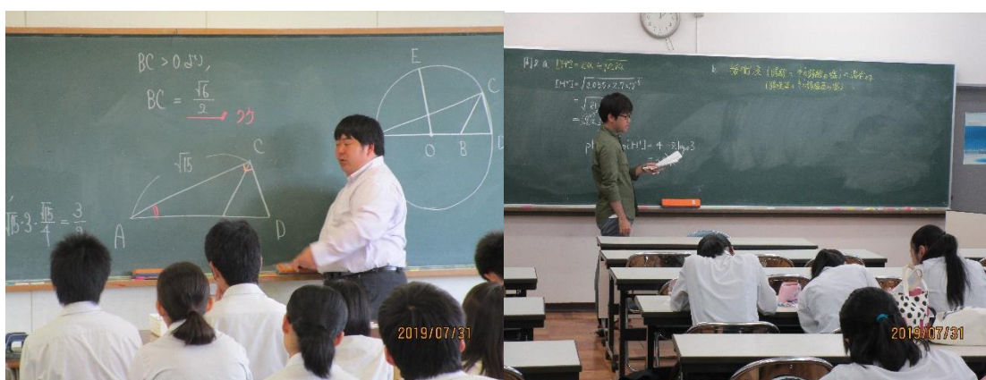
7月31日 数学「三角比」の講義