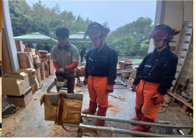
R5卒業生からの技術指導(10/5)