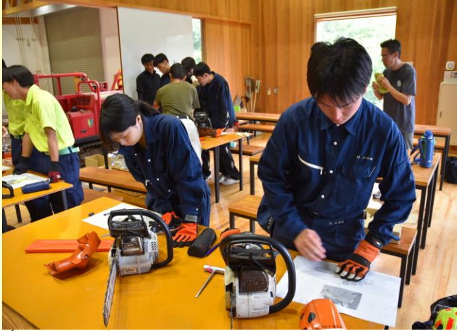
チェーンソーの構造についての研修(8/7)

今年度は岐阜県伐木安全技術評価会に3Nの2名が参加するため、8月7日と10月5日に森林文化アカデミーで開催された研修に参加し、講師の先生のほか森林文化アカデミーに進学した、令和5年度卒業生と令和6年度卒業生の2名とも交流しながら技術指導を受けました。