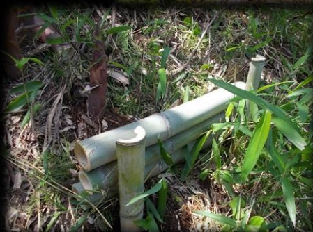
強度がなく、試行錯誤しました・・・