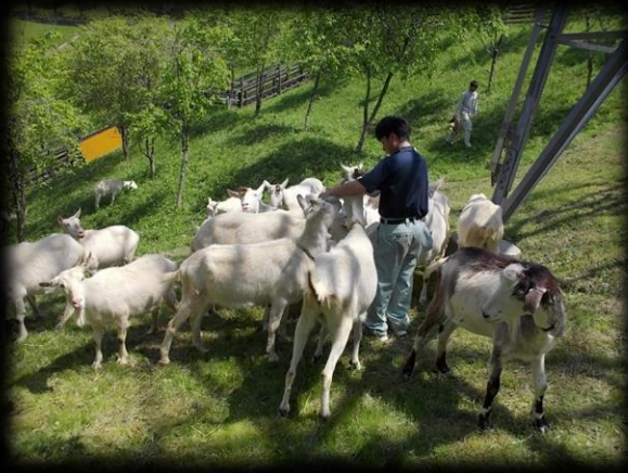
ヤギさん除草隊ともふれあいました。