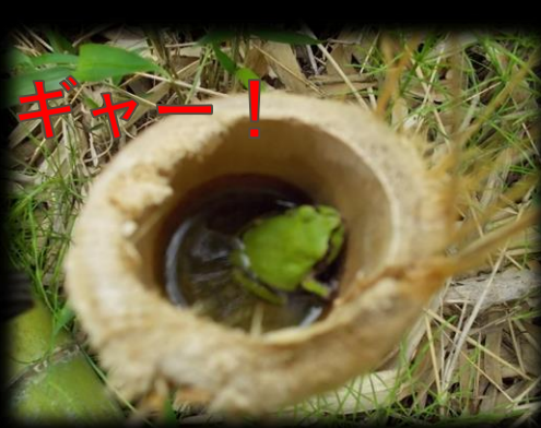
竹を切ったら中に「かえる姫」もいました。