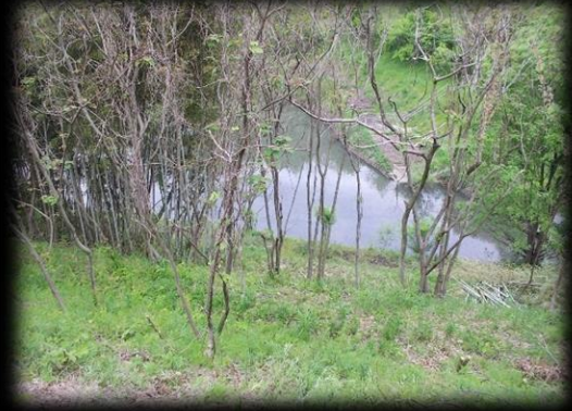
約30本の竹を切るとこんなにも見晴らしが良くなりました。