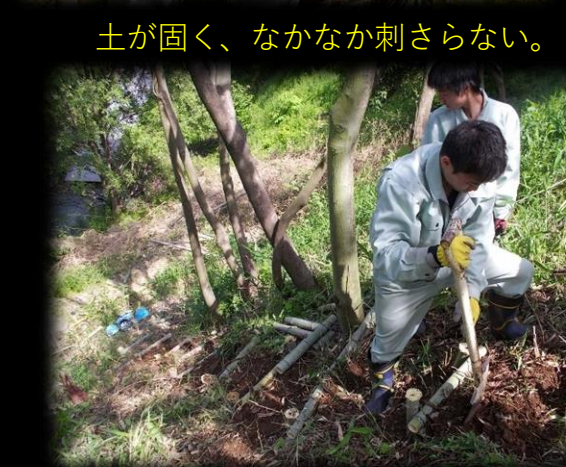
土が固く、なかなか刺さらない。