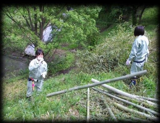
2 mほどに切り、まとめます。