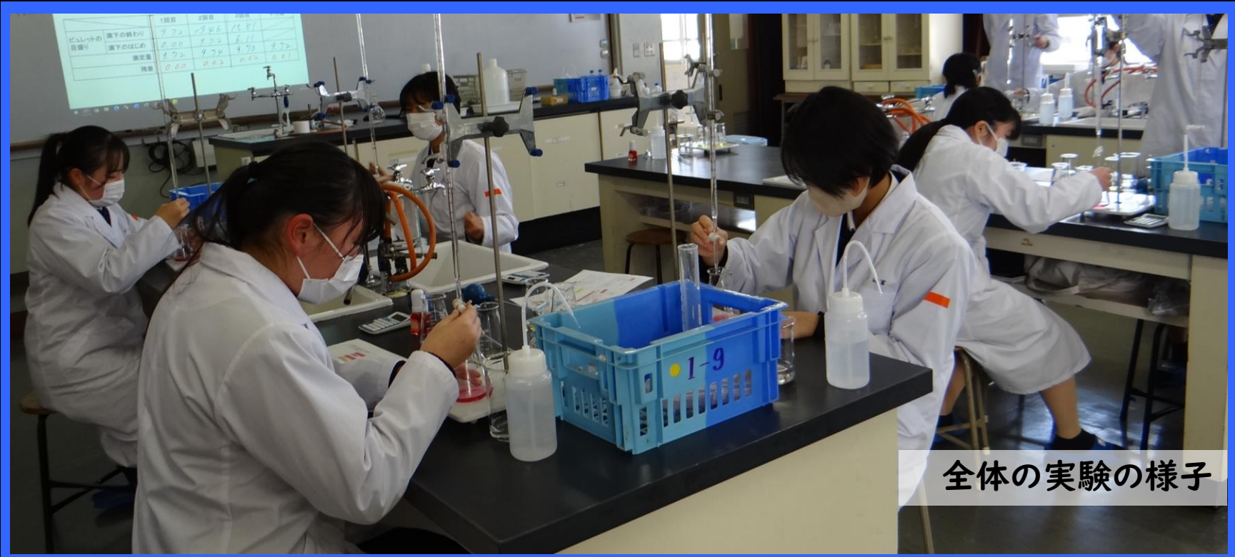
全体の実験の様子