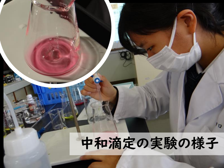
中和滴定の実験の様子