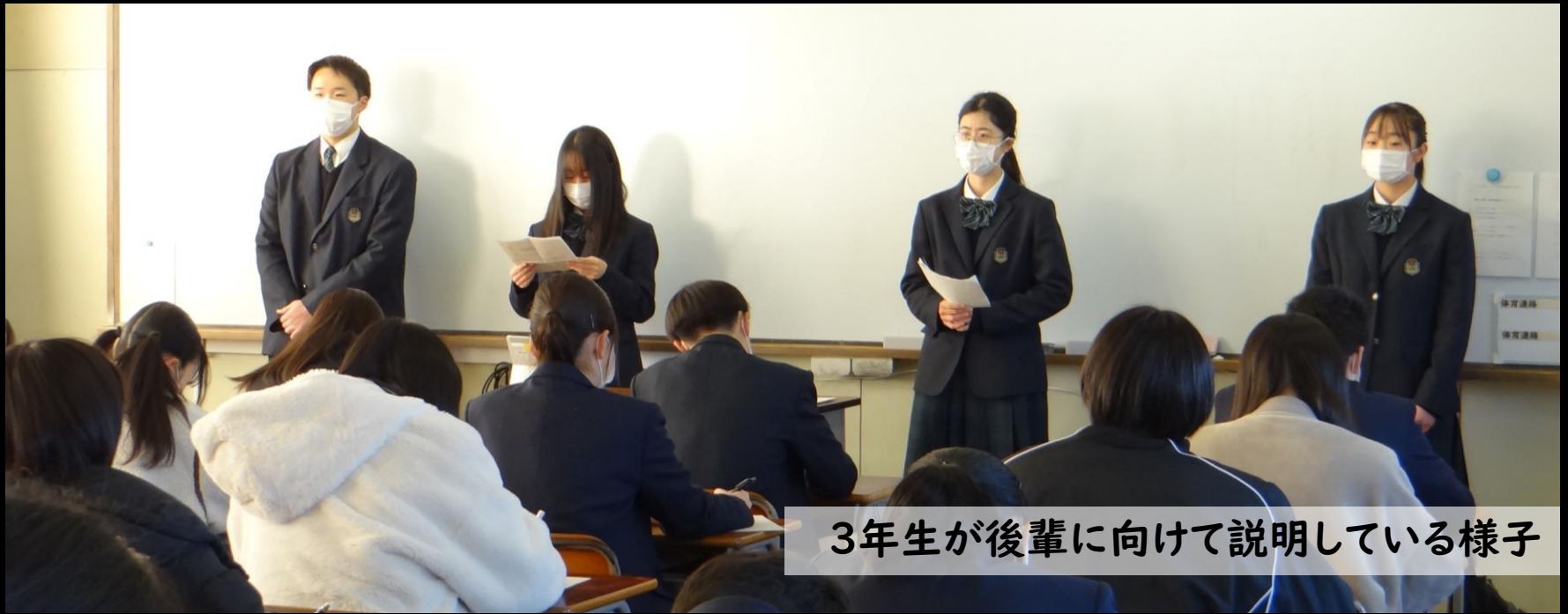
3年生が後輩に向けて説明している様子

進学や就職する先輩(3年生)が後輩(1.2年生)のために、「進路決定までの道筋」や「これだけは頑張っておけば良かったこと」、「今まで苦労したこと」等を実体験をもとに語ってくれました!!!