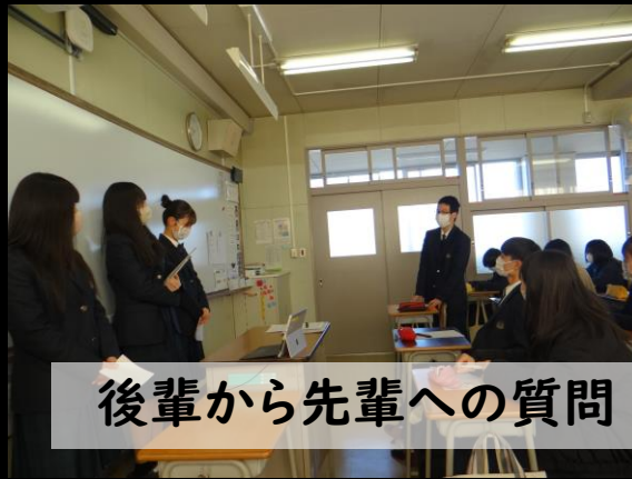
後輩から先輩への質問