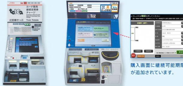
購入画面に継続可能期限が追加されています。

「通学証明書」を提出して通学定期券を購入した場合、卒業予定年まで近距離券売機、指定席券売機、サポート付き指定席券売機にて継続して購入が可能です。駅係員窓口での購入の必要はございません。