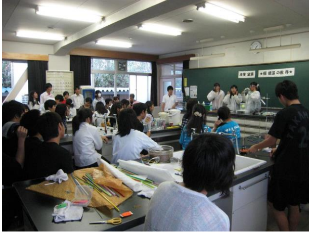
極低温実験（文化祭）