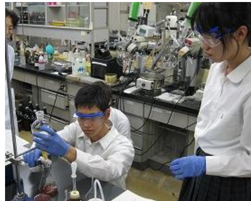
高校生のための化学講座（岐阜大学工学部）