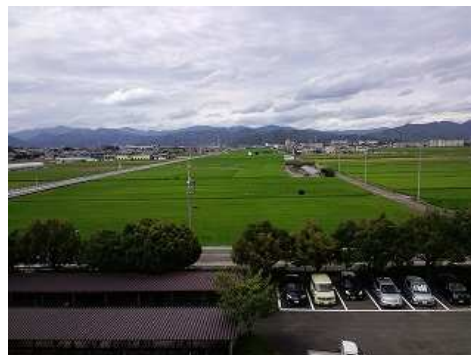
教室棟4階から北に美しい池田の水田が見渡せます（7月）。