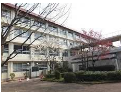
中庭の紅白のハナミズキがきれいです（5月）。