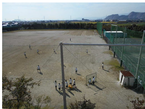
特別棟4階から南に大垣方面を眺めます。