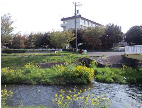
池田高校の西を流れる東川…菜の花が満開です（4月）。 秋には蛍が見られる美しい川です。