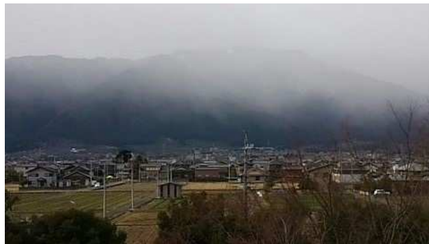
池田高校から霧にむせぶ池田山を望みます（1月）。