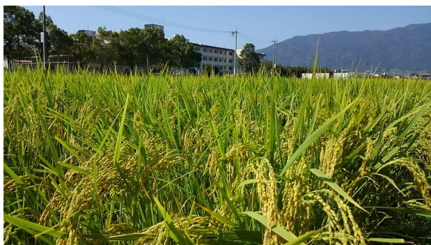
池田町は豊かな水に恵まれ水田が広がっています。稲穂が実りの時期を迎えています。（背景は池田高校と池田山）