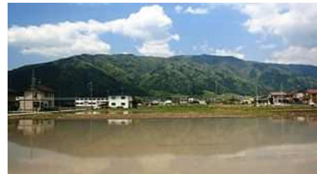
Le mont Ikeda et les rizières s'étendant à son pied

Depuis la vallée de Kamagatani, « monument naturel national » célèbre pour ses cerisiers, jusqu'au sommet du mont Ikeda à 924 mètres au-dessus du niveau de la mer, « la forêt d'Ikeda » est un parc national s'étendant sur une zone de 103 hectares, au sein duquel un chemin de montagne et une chaussée ont été aménagées.