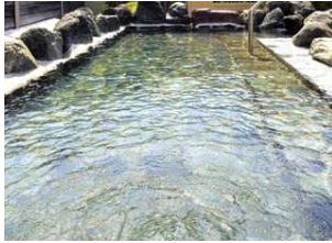
Bain en plein air