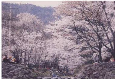
Kamagatani au printemps

À l'arrivée du printemps, de nombreuses variétés de cerisiers fleurissent de concert au bord des ruisseaux : yamazakura , yoshinozakura , shidarezakura , etc. Vue de loins, cette profusion de fleurs de cerisiers fait penser à une brume : c'est ainsi que la vallée fut nommée Kamagatani, « vallée entourée de brume ».