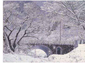
Kamagatani en hiver