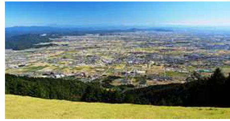
Vue sur le bourg d'Ikeda depuis le mont Ikeda

Le bourg d'Ikeda se situe à l'extrême nord de la grande plaine alluviale de Nōbi, créée par les trois rivières de Kiso (la Kiso-gawa, la Nagara-gawa et l'Ibi-gawa). À l'ouest, se dresse le mont Ikeda à 924 mètres d'altitude, qui occupe un tiers de la superficie du bourg. Le bourg d'Ikeda borde le bourg de Gōdo à l'est et la ville d'Ōgaki au sud, le bourg de Tarui à l'ouest et le bourg d'Ibigawa au nord. La route nationale 417 traverse le bourg du nord au sud : l'emprunter vous permettra d'accéder à la ville d'Ōgaki (12 km) et à la ville de Gifu (20 km).