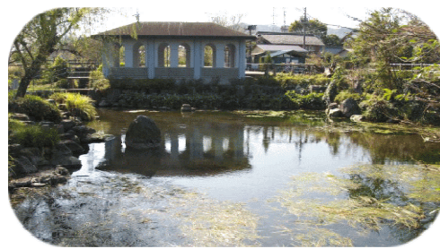
Source à Kami-Yawata où les Hariyo vivent