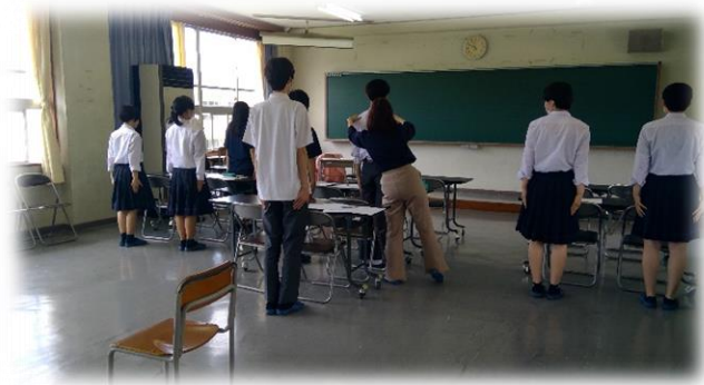
正しい姿勢の指導