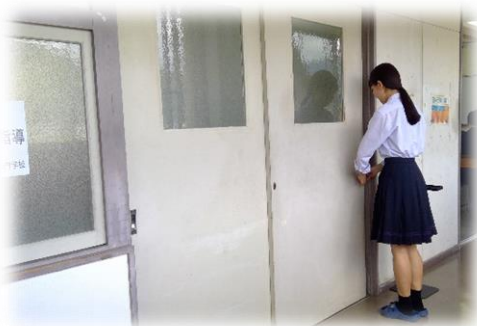
面接時の入室方法の指導