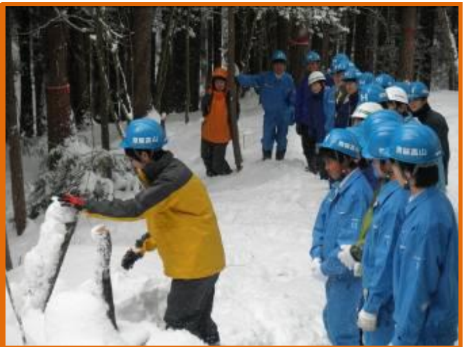
【原木が完全に雪に埋まっている！】