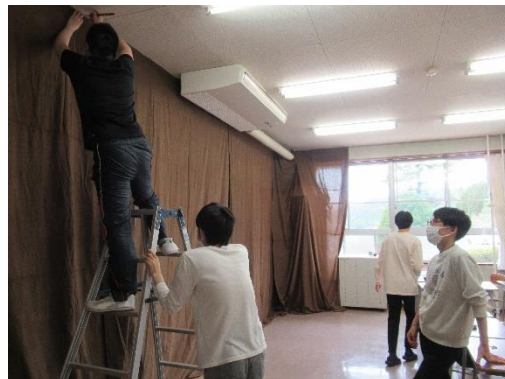
天井から吊します