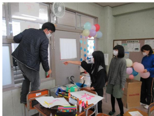
クラステーマの提示中