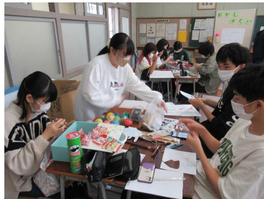
グループごとに製作中