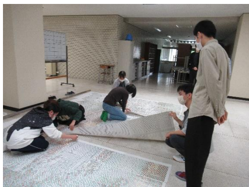
シールモザイクアート作成