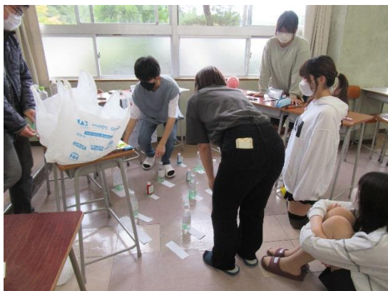
ペットボトル倒しの配置確認