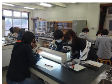
理科の観察実験風景