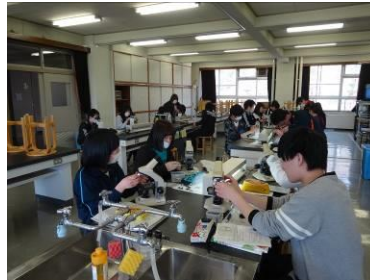
理科の観察実験風景