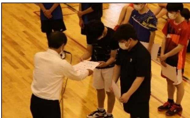
4年 青山・宮田ペア 準優勝（東海大会出場）