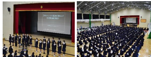
統一生徒総会の様子