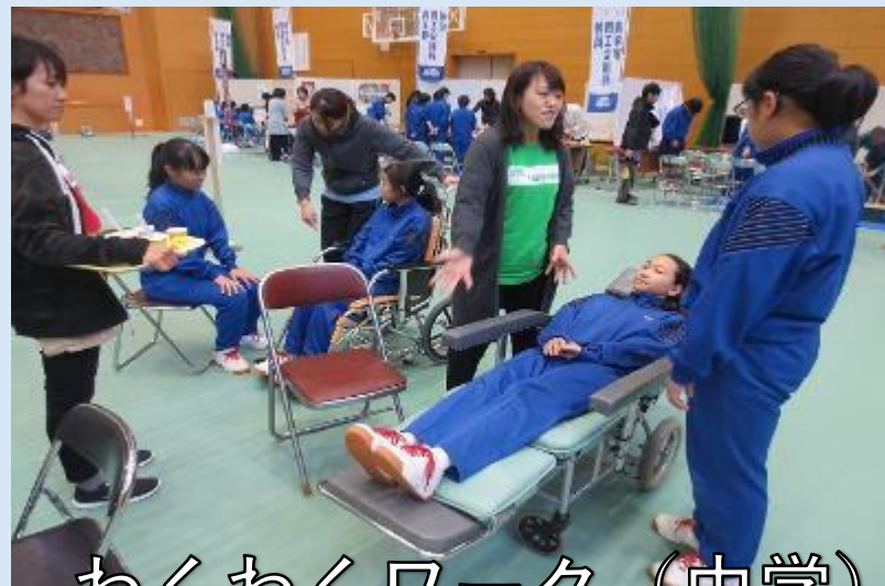
わくわくワーク (中学)