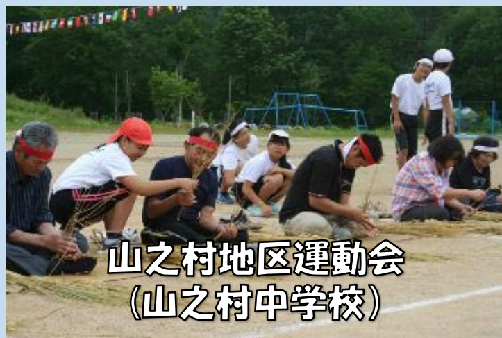
山之村地区運動会 (山之村中学校)