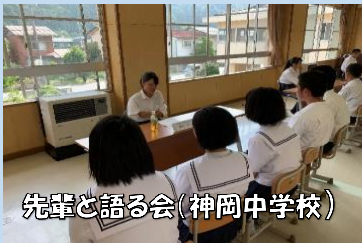
先輩と語る会(神岡中学校)