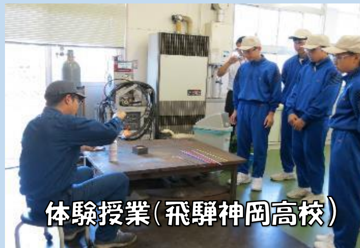
体験授業(飛騨神岡高校)