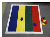
まとあて名人セット