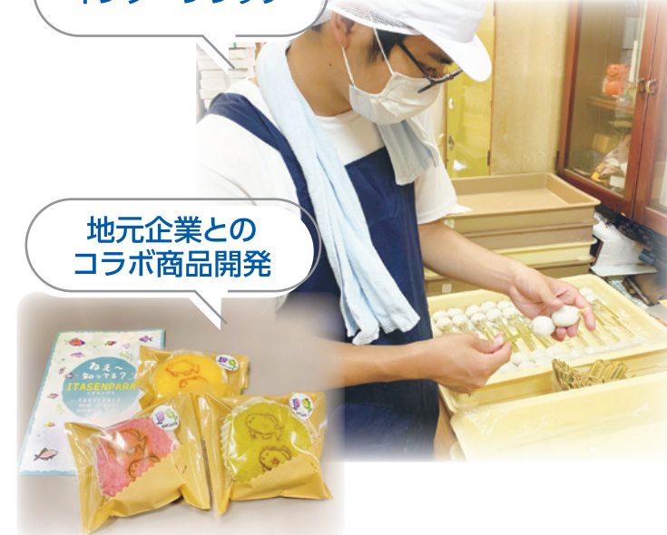
地元企業との コラボ商品開発