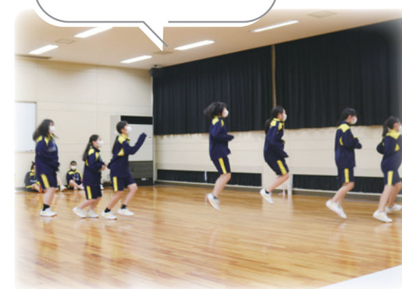
演劇ワークショップ