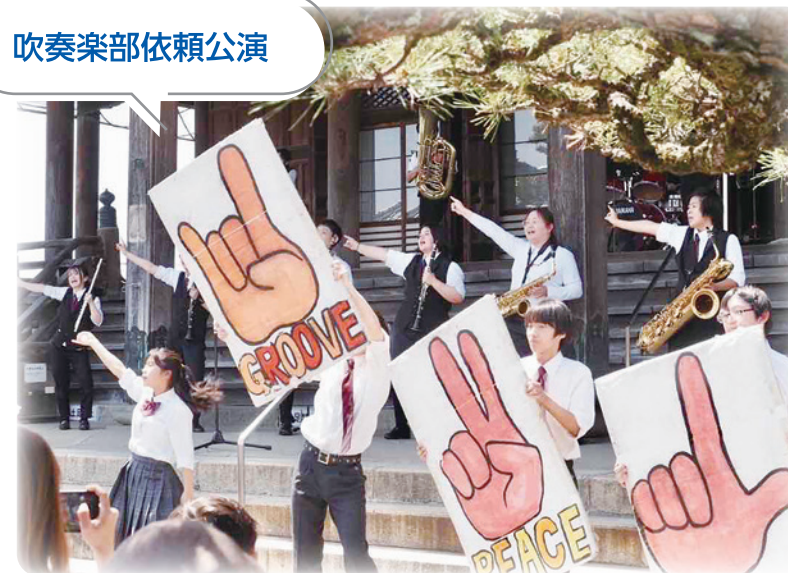
吹奏楽部依頼公演