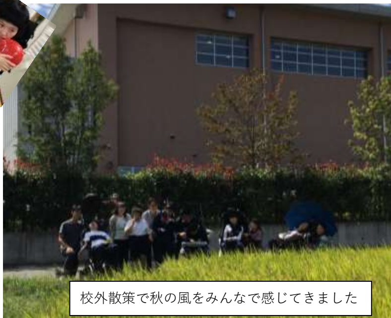
校外散策で秋の風をみんなで感じてきました