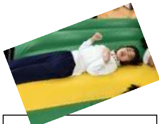
エアートランポリン