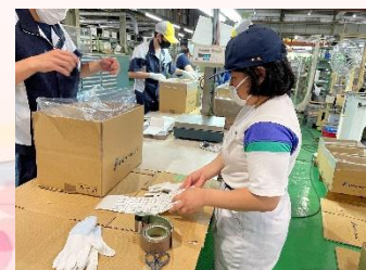
大同メタル工業株式会社

※進路通信には個人情報が含まれています。管理・廃棄については十分注意してください。