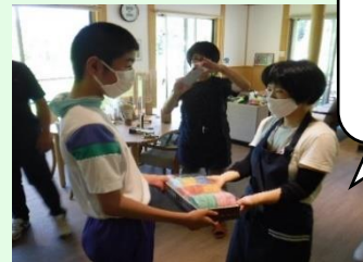
ともいきの里東弥