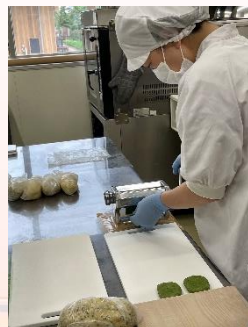
ともいきの里東弥