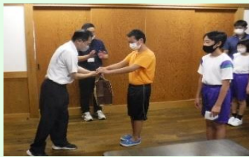
道の駅清流の里しろとり

7月19日(月)、ともいきの里東弥、あゆパーク、道の駅清流の里しろとりに中学部作業製品の納品に行きました。製品を作るときに工夫したことを担当の方に説明し、受け取っていただきました。納品先の方々から、直接、感謝の言葉や次回の注文をいただき、生徒は喜びを感じることができました。製品を待っていてくださるお客様がいることを知り、今後の作業学習への意欲につながりました。また、納品先の方から、中学部製品の使いやすさや良さについてもお話しいただきました。自分たちが作っている製品への自信を高め、より良い製品づくりを目指す意識づけとすることができました。次回の秋の納品に向けて、今後も仲間とともに作業学習に取り組み、働くために必要な力をつけていきたいと考えます。