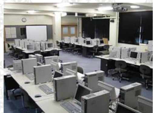
コンピューター室