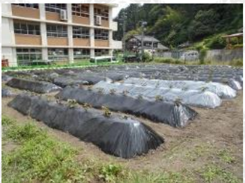
森林科学科棟裏圃場