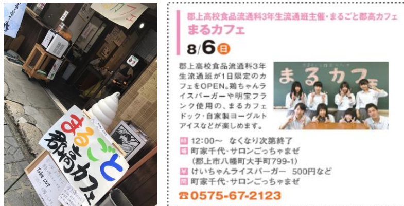
写真-3・4 カフェ外観(左)・GUJO+掲載内容(右)

日時・場所：平成29年8月6日（日）ぶなの木セルプの店「町家千代」 ターゲット：SNSを使っている観光客 目的：観光客を含む多くの人にこの活動を知ってもらう 活動内容：部活への依頼、INGやGUJO+による宣伝