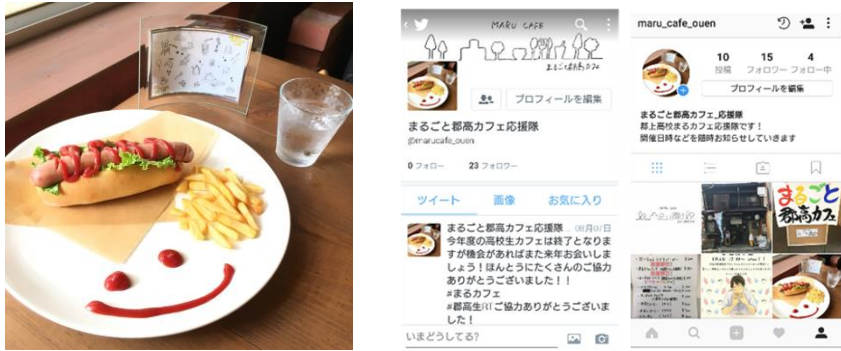
写真-1・2 明宝フランクを使ったメニュー(左)・SNSでの宣伝活動(右)

日時・場所：平成29年7月2日（日）コミュニティカフェななしんぼ ターゲット：SNSをよく使っている若い女性 目的：明宝をアピール SNSでの集客効果を調べる 活動内容：部活への依頼、SNSの稼働、地元のPRになるメニュー