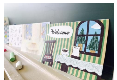
写真-5 美術部に協力してもらった店内掲示用はがき

今回の目標であった、「流通班が架け橋となって郡上高校全体をPRしていく」に対して、私たちの達成度はまだまだ30%程度である。今後もっと郡上高校全体をこの活動に巻き込んでほしい。