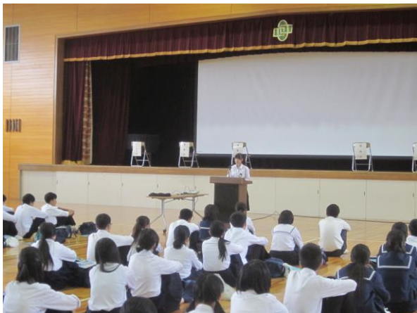
3日 (火) 生徒代表による挨拶