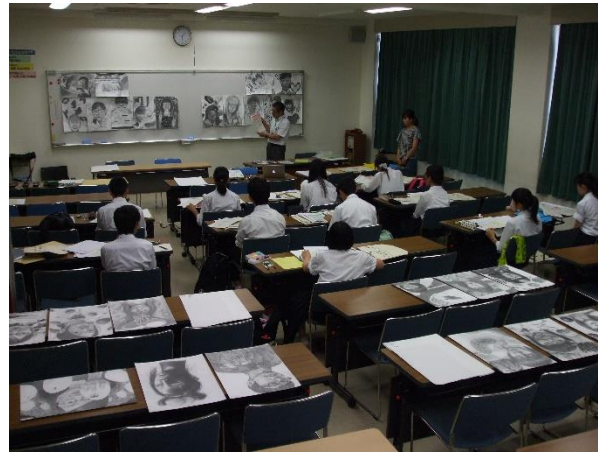
参考作品もたくさん