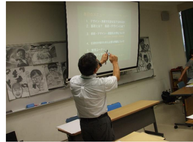
鉛筆の削り方実演