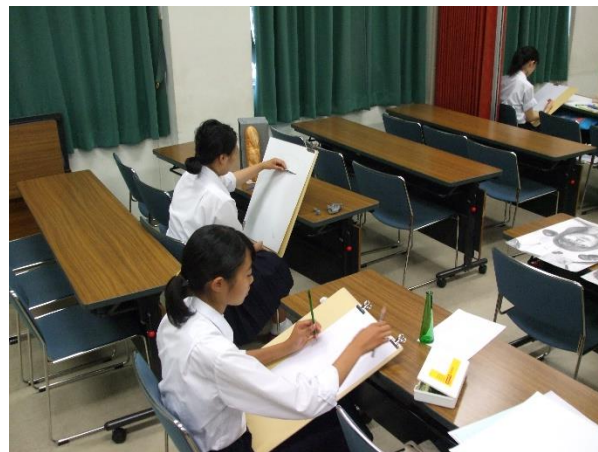
各自の課題に取り組む