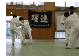
Câu lạc bộ võ Judo