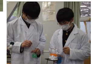
Câu lạc bộ hóa học