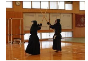
Câu lạc bộ Kiếm đạo (Kendo)