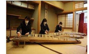
Câu lạc bộ đàn Koto