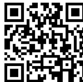
申込 QR コード

U R L : https://forms.office.com/r/XRSeurywxn