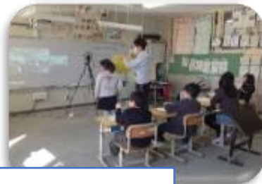
近隣の小学校・他の聾学校との交流