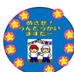
学習のまとめで獲得するメダル 「〇〇マスターメダル☆」