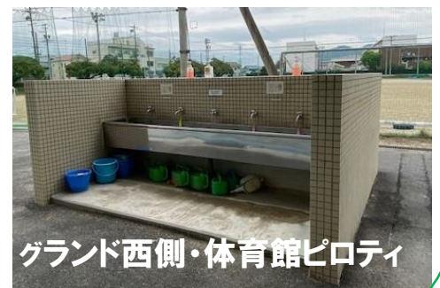
グランド西側・体育館ピロティ