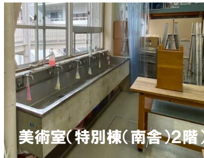
美術室(特別棟(南舎)2階)