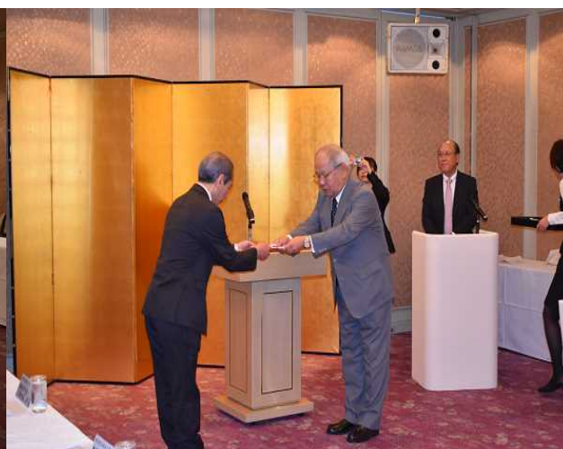
副校長先生が目録をいただきました