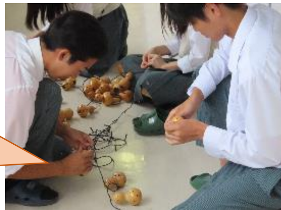
↑瓢箪電飾取付の様子

作業は大変だったが完成できて良かった！ 学科を超えて活動できて良かった！ 作業は疲れた 担当の人が優しく教えてくれた