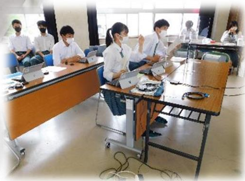
農ク役員はこんな形で運営を行っていました