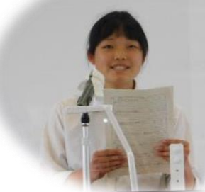
II 塁 最優秀賞